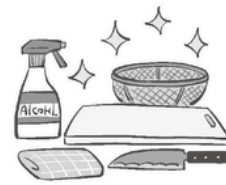
手指や調理器具は清潔に