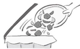
少しでも怪しいと思ったら捨てる